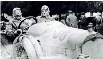
01|Audiの歴史/エピソード